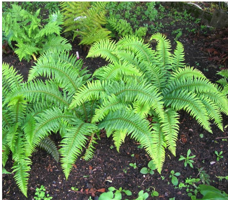
Arends Schildfarn Polystichum xarendsii im Freiland der Gärtnerei Arends-Maubach.

für die mikroskopische Untersuchung der Sporen und das dokumentierende Foto.